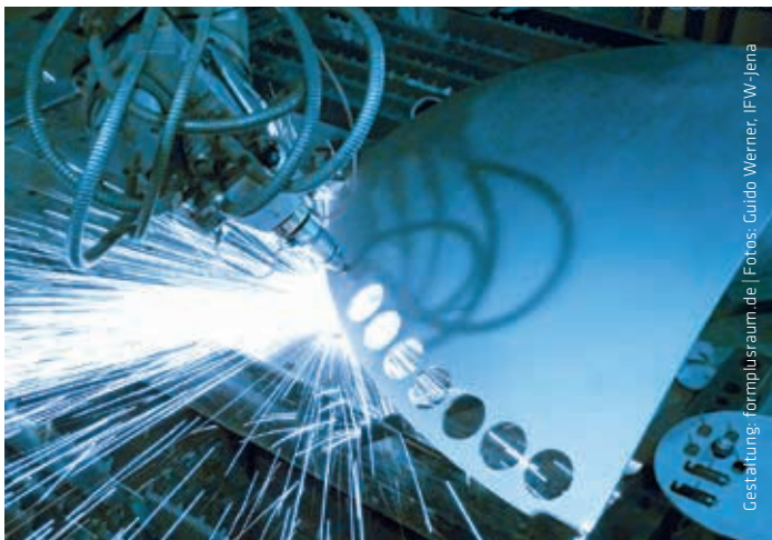
Gestaltung: formpulsraum.de